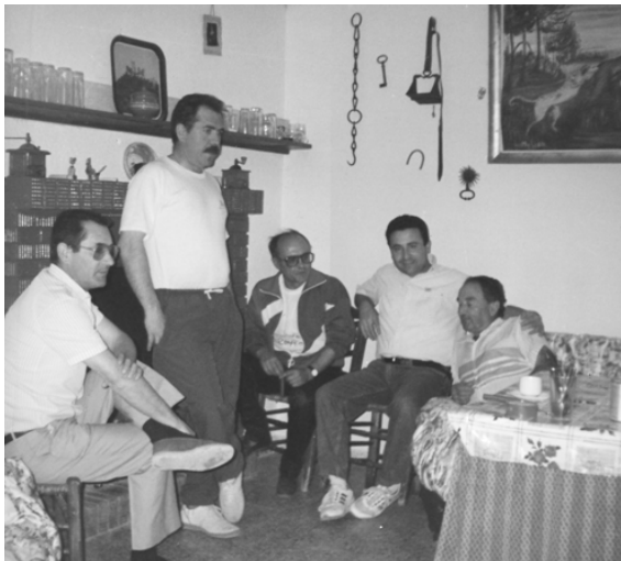
En casa de unos amigos en Torres cogiendo cerezas