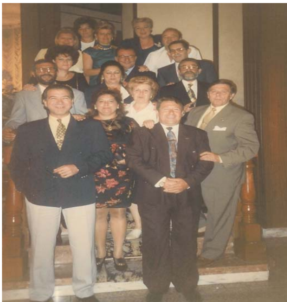
Varios miembros de la FAAR en un congreso en Galicia

que entro a formar parte de la Junta Directiva de la Federación, lo nombramos como responsable de la publicidad, él a sido el encargado de encargar todo el material que se ha estado utilizando en la Campaña del día sin Alcohol, al principio para toda Andalucía después para toda España, el material para todas las campañas al principio se elaboraba donde más barato nos costaba, después solo se hace en Madrid en una empresa que él conocía por medio de los trabajos que en los años que estaba en transportes les realizaba al Ayuntamiento. No quiero pensar porque será y si tuviera pruebas podría ser mas explicito, eso no quiere decir que no tenga mi propia opinión.