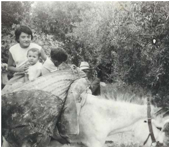
Mi padre con mis dos hijos pequeños y mi hermana en un burro que lleva un serón

había volcado el serón, (serón; especie de sera más larga que ancha, que sirve para carga de una caballería) le extraño de que el animal con la carga medio caída estuviera suelto comiendo, a mi padre no lo vio.