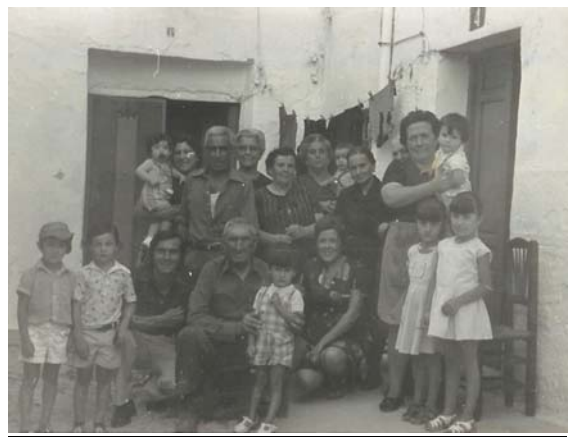
Grupo de vecinos en la puerta de casa de mis padres detrás de los corrales

varias huertas que sembraba de maíz, la gente de mi pueblo veníamos por la mañana a desojar las piñas, teníamos que recorrer por veredas doce o trece kilómetros. Cuando apañábamos hojas suficientes para cargar las barcinas (redes que se tejían con sogas, realizadas en esparto en las provincias de Córdoba y Jaén), dos por animal que llevábamos, las cargábamos y nos dirigíamos hacia el pueblo, estas hojas había que quitarle los pezones dejarlas secar antes de meterlas en los colchones.